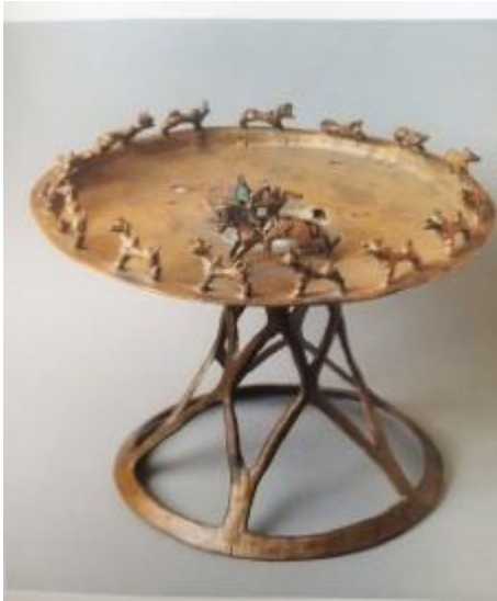
4-сурет- Алматы аумағынан табылған қола қазан. б.д.д. 5-3 ғғ.