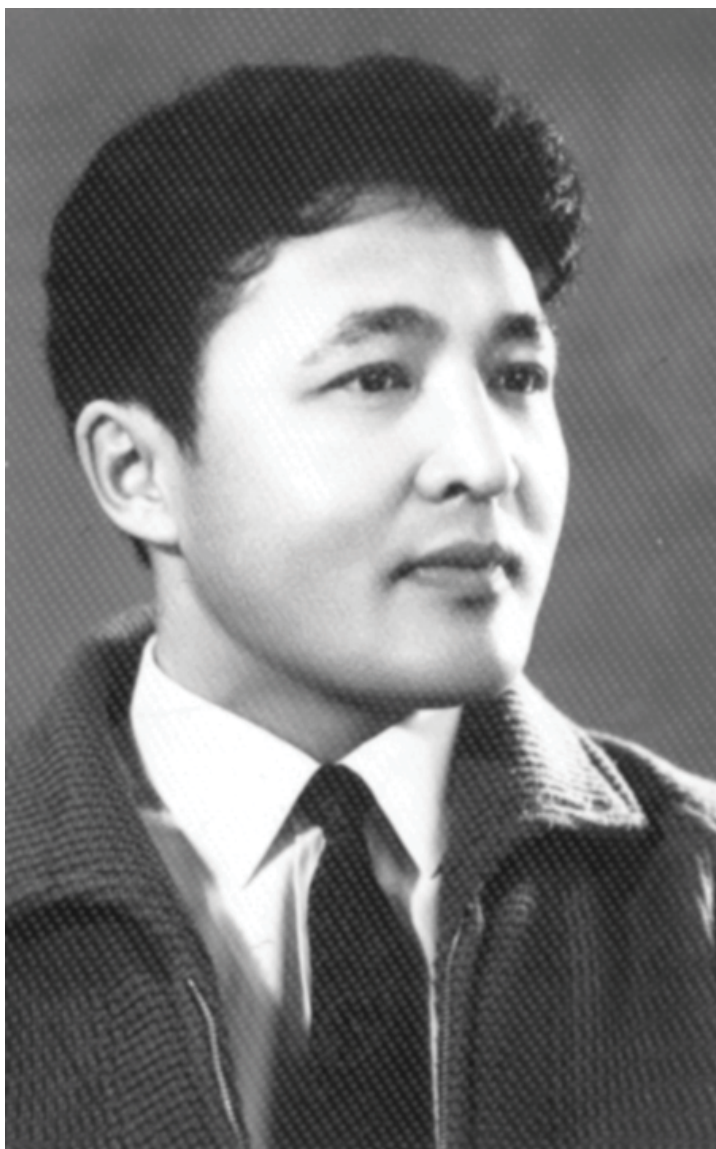
МГУ бітіргенде. 1969 ж.