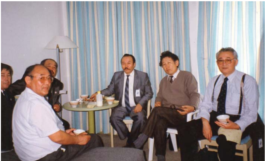
Түркітілдес халықтарының құрылтайы. Анталья, 1993 ж.