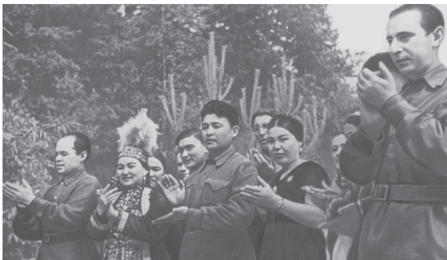
Мастера искусства Казахстана дают концерт на фронте для воинов-красноармейцев.

«Два бойца», «Фронт», «Она защищает Родину», «Жди меня» и другие шедевры кино, оказавшие большое влияние на гражданское становление и воспитание патриотизма миллионов людей и вселявшие в них веру в победу.