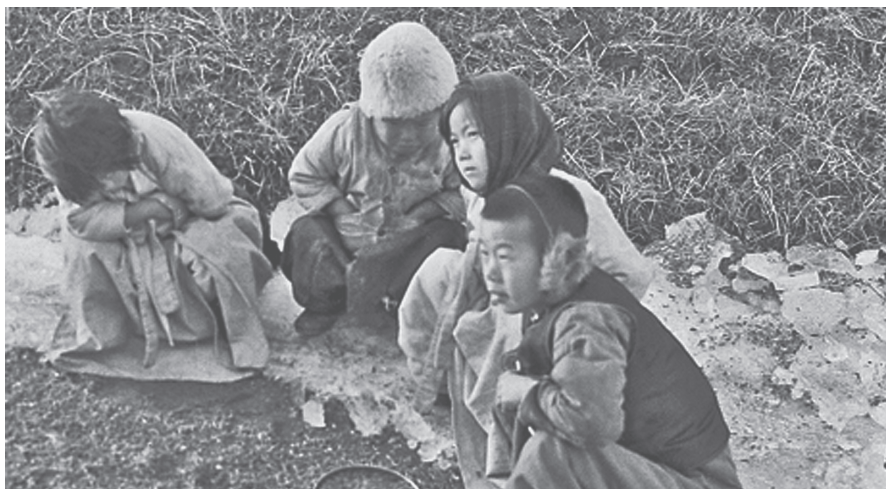
Депортированные корейские дети.

2. Депортация народов Дальнего Востока, Поволжья и Кавказа в Казахстан. В то время, когда советские люди проявляли мужество и героизм ради общей Победы, сталинская преступная клика продолжала геноцид собственного народа. Уже не ограничиваясь истреблением «врагов народа», она перешла к физическому и моральному террору против целых этнических общностей, насильственно перемещая их с родных мест. Одними из первых жертвами депортации стали советские корейцы Дальнего Востока. В Казахстан было переселено в 1937 году около 100 тысяч представителей этого этноса. Массовой высылке подверглись также поляки, финны, курды, крымские татары, турки, греки, западные белорусы и западные украинцы, литовцы и др.